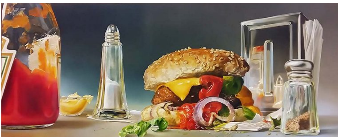
FoodSpace (2014), Tjalf Sparnaay