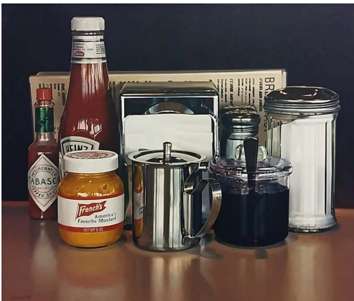
America's favourite (1989), Ralph Goings

In de 20e eeuw ontstonden er allerlei 'rare' kunststromen, zoals body art en conceptuele kunst. Er waren hierdoor ook kunstenaars die vanaf de jaren zeventig dachten: Laten we de werkelijkheid maar weer eens weergegeven, zoals die is. Zo neutraal en waarheidsgetrouw mogelijk. Hierdoor ontstond de kunststroming hyperrealisme. En heel veel schilderijen hadden betrekking op eten. Kijk maar: