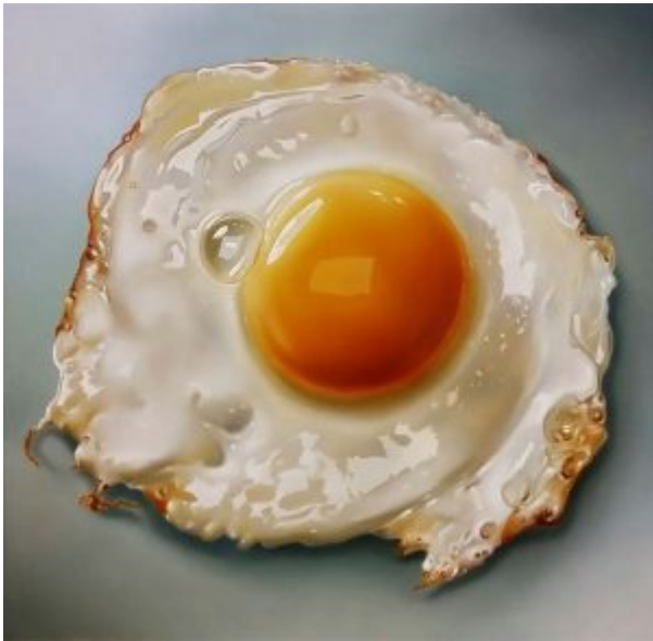
Fried Egg (2015), Tjalf Sparnaay

Voel je de smaak van het ei al in je mond?